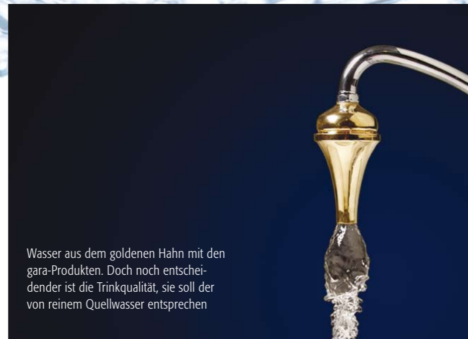
Wasser aus dem goldenen Hahn mit den gara-Produkten. Doch noch entscheidender ist die Trinkqualität, sie soll der von reinem Quellwasser entsprechen

Nicht nur Privathaushalte sind von ihrem verbesserten Trinkwasser aus dem Hahn begeistert, auch Gastronomiebetriebe wurden hellhörig. So ließ sich die Kratz-