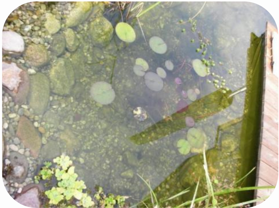
nach der Anwendung